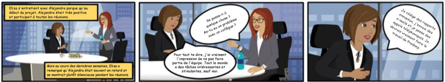
Exemple de bande dessinée intégrée à l'examen

Vidéo d'animation : s'agissant des questions avec vidéo d'animation, les candidats devront visionner la vidéo correspondante. Les candidats peuvent la visionner à plusieurs reprises et utiliser les commandes pour démarrer la vidéo, l'arrêter, revenir en arrière, etc. En fonction du scénario, le candidat recevra une question à choix multiples à laquelle il devra répondre. Un casque sera remis aux candidats au centre de test. Les animations seront accompagnées de son et d'un sous-titrage.