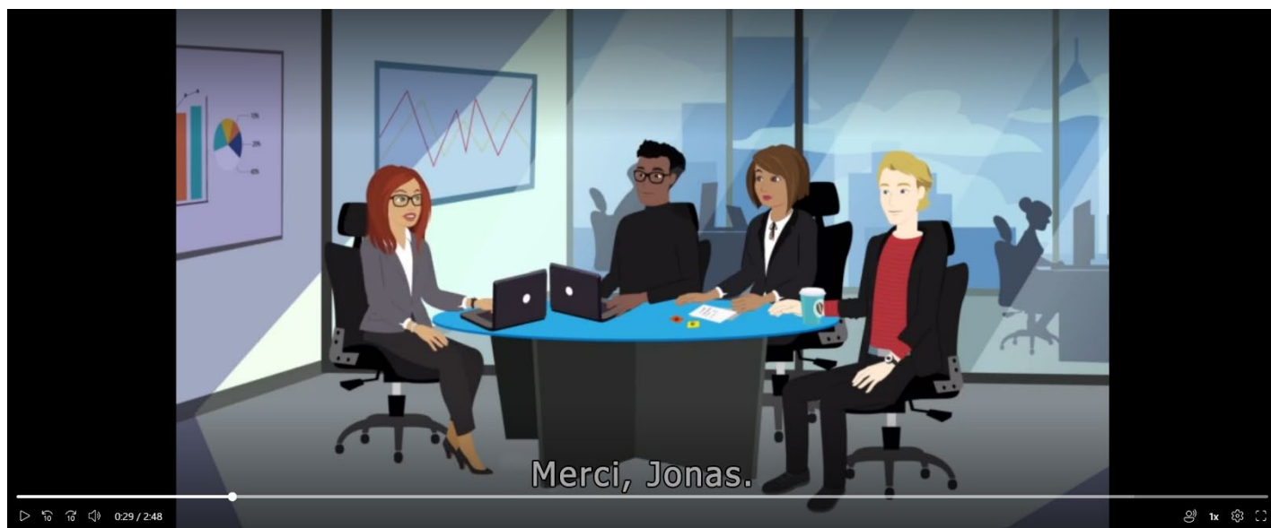
Exemple de vidéo d'animation intégrée à l'examen

Correspondance améliorée : s'agissant des questions de correspondance améliorée (glisser-déposer), les candidats se verront afficher deux colonnes avec des cases. Un scénario leur sera présenté et ils devront faire correspondre les cases de gauche avec celles de droite (de droite à gauche pour les candidats de langue arabe). Il suffit dans ce cas de cliquer sur l'une des cases du côté gauche et de la faire glisser vers la case appropriée sur le côté droit. L'opération doit être répétée pour toutes les cases de la colonne de gauche.